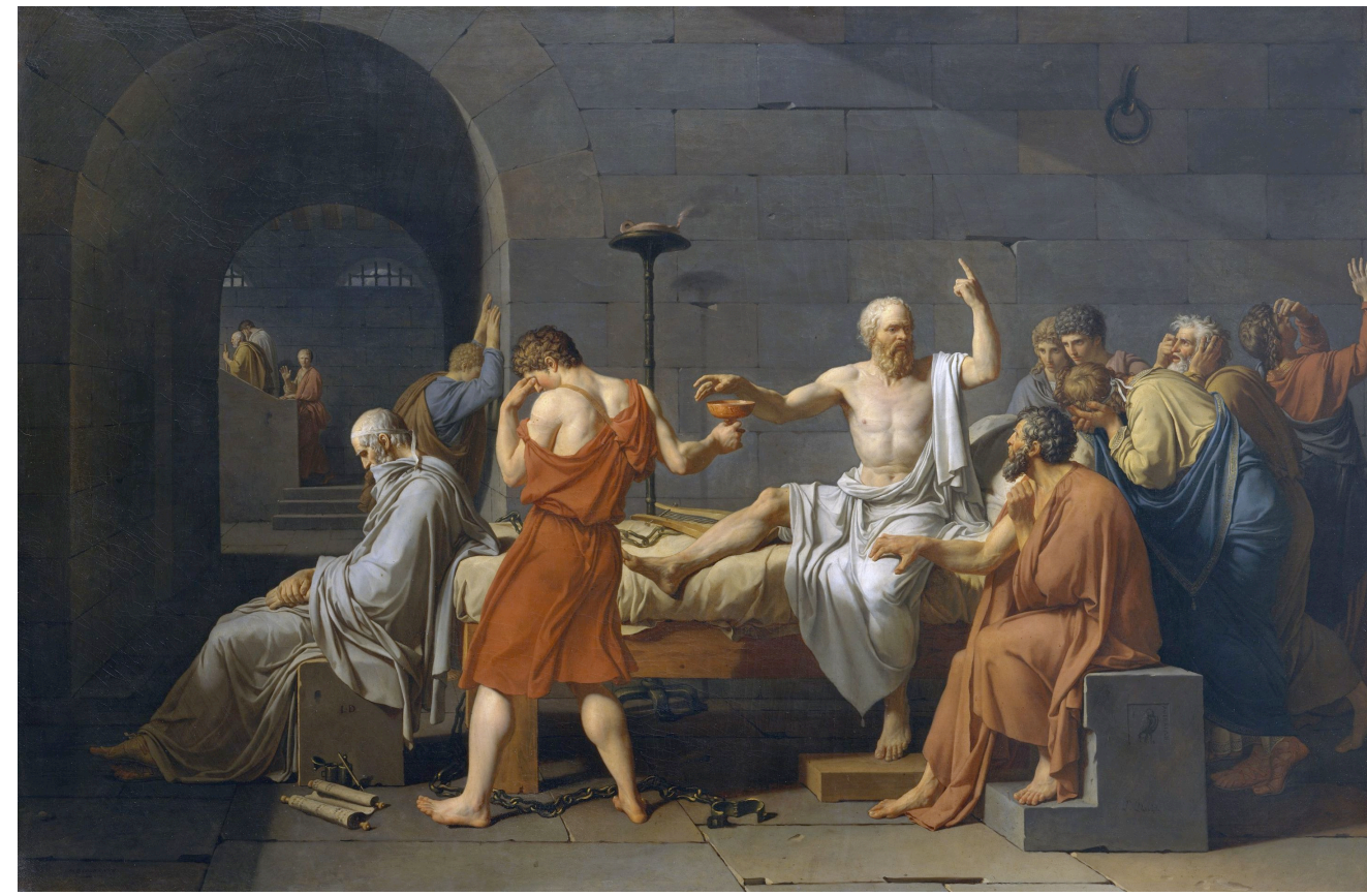
David, La mort de Socrate