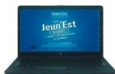
HP 240 G7